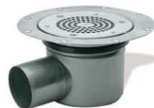
ACO Stainless EG 150