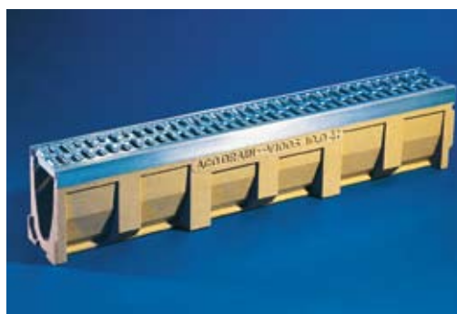
ACO DRAIN® Multiline®